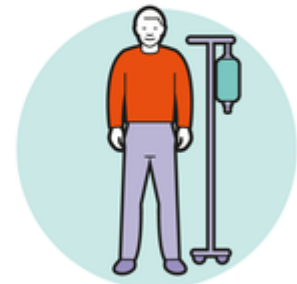
Eher Menschen mit Vorerkrankungen