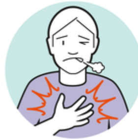
Atembeschwerden oder Atemnot