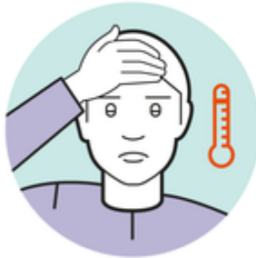
Fieber oder erhöhte Temperatur

Die Symptome ähneln grundsätzlich denen einer Erkältung.