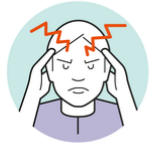
Muskel- und Kopfschmerzen

Durchfall scheint eher selten vorzukommen.