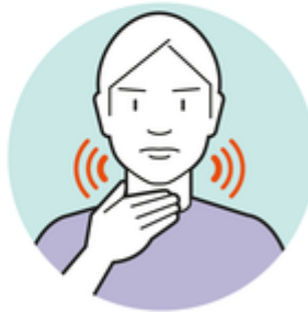
Husten oder Kratzen im Hals